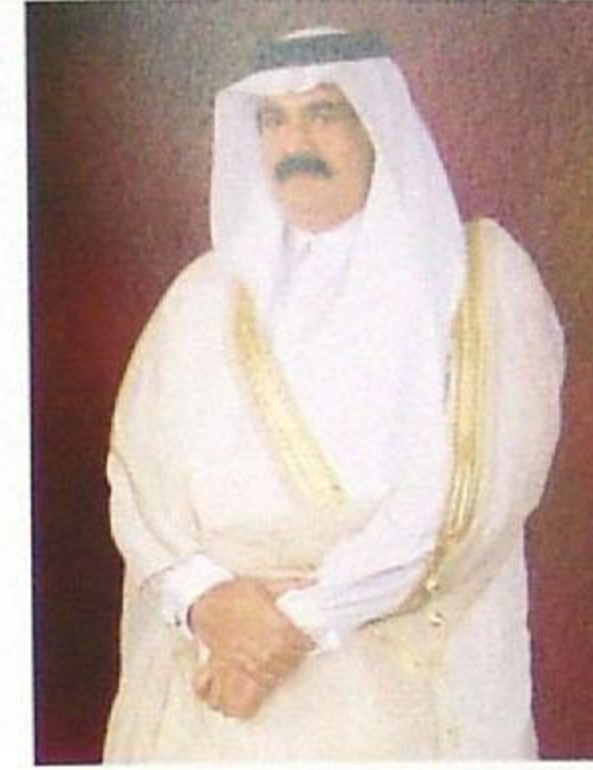
حضرة صاحب السمو الشيخ حمد بن خليفة آل ثاني أمير دولة قطر المفدى

الشيخة المياسة بنت حمد بن خليفة آل ثاني رئيس مجلس أمناء هيئة متاحف قطر